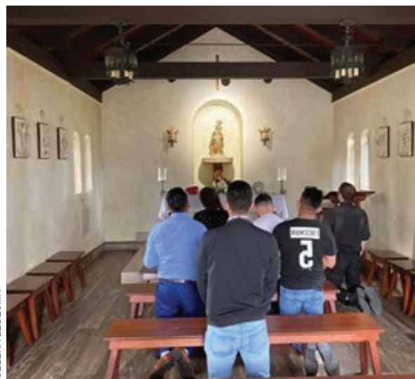
Amistad Jóvenes de la Pastoral Juvenil rezando juntos frente la imagen de Nuestra Señora de la Leche en San Augustine, FL

Jesús da un ejemplo de este tipo de amistades. Especialmente lo vemos en su amistad con sus apóstoles cuando les dijo apenas unas horas antes de ser ejecutado, “nadie tiene mayor amor que este, dar la vida por los amigos”. Sin embargo, la amistad no se trata solo de recibir, también se trata de dar. Recuerden que las verdaderas amistades, especialmente aquellas que se centran en la santidad, de-